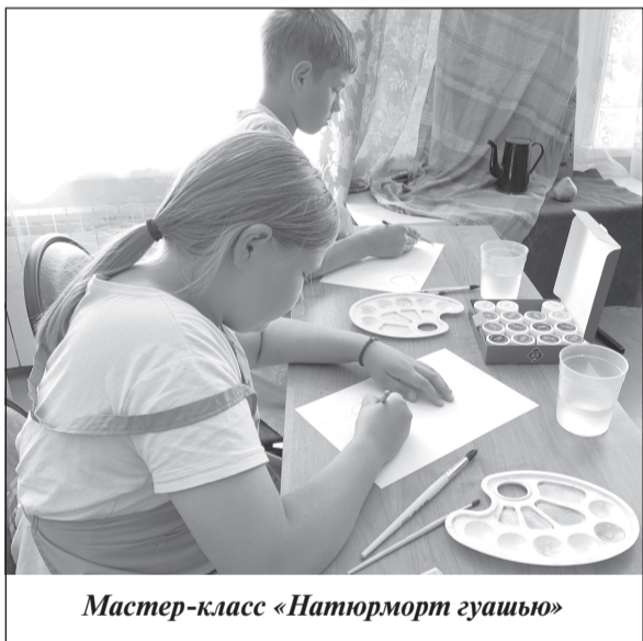
Мастер-класс «Натюрморт гуашью»

На базе Детской школы искусств (г. Плес) состоялся цикл творческих занятий в рамках проекта «Свежее течение», который реализуется с использованием гранта Российского фонда культуры в рамках нацпроекта «Культура».