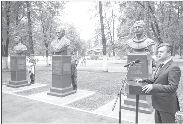
«Огромная честь для жителей Ивановской области, что Аллея Славы открывается именно здесь, в Иванове», - подчеркнул Станислав Воскресенский.

Торжественные мероприятия, приуроченные к 55-й годовщине образования 610-го Центра боевого применения и переучивания летного состава Военно-транспортной авиации, прошли в Иванове.