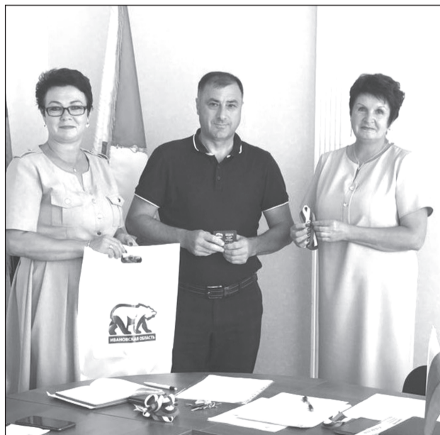
Торжественное вручение партбилета

Первым пунктом повестки дня политсовета стало торжественное вручение партийных билетов. Первичное отделение села Ингарь пополнилось двумя единороссами, в.д. Парушево - одним.