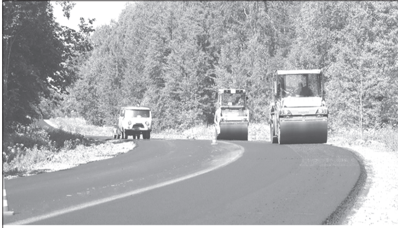
Обеспечить транспортную доступность - это важно

К одному из самых отдаленных населенных пунктов Ивановской области – селу Колшево Заволжского района – началось строительство газопровода, также проводится ремонт дороги, связывающей село с райцентром.