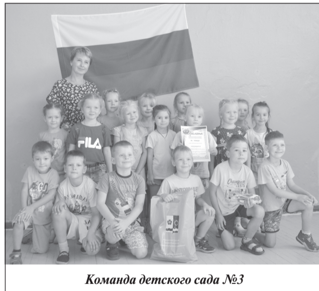
Команда детского сада №3

В этот же день в зале ДЮСШ состоялась квест-игра для дошкольников «Гордо реет флаг России!».