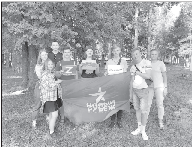
«Мы за мир, за нашу Родину!»

под таким лозунгом активисты молодежного патриотического движения «Новый Рубеж» провели акцию в поддержку российских военнослужащих, принимающих участие в спецоперации.