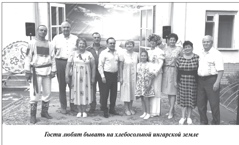
Гости любят бывать на хлебосольной ингарской земле