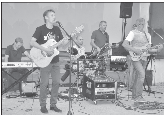
Музыкальный вечер на танцплощадке сада «Текстильщик»