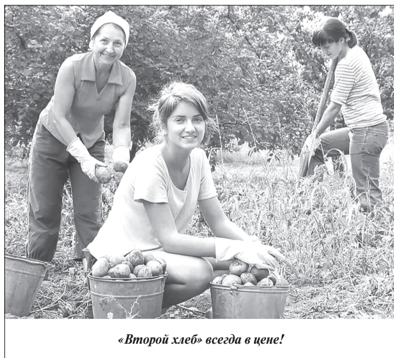
«Второй хлеб» всегда в цене!

Хотя картошка всегда была палочкой-выручалочкой, подспорьем для россиян в непростые времена. И сегодня многие наши земляки возвращаются к заброшенным участкам, заботятся о «втором хлебе».