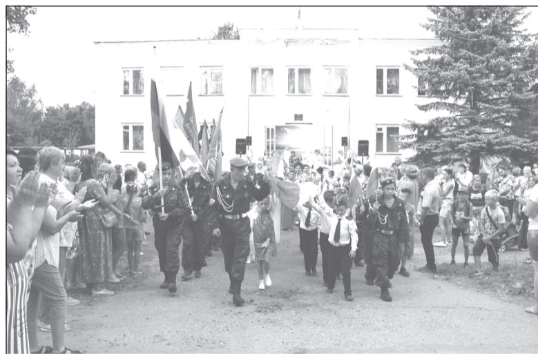
Бурными аплодисментами ингарцы приветствуют юных патриотов