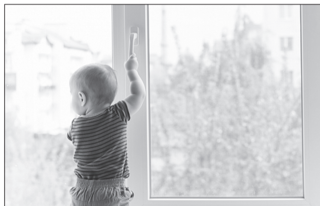
Не оставляйте ребёнка без присмотра у окна, это может обернуться катастрофой

За оставление ребенка у открытого окна без присмотра взрослых предусмотрены