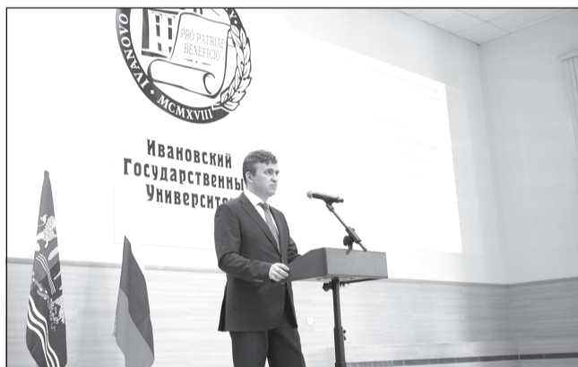
Августовская конференция работников образования Ивановской области.

По словам губернатора, именно школьное образование является базой для качественного высшего образования. «Мы видим, что во всем мире новые разработки и прорывы происходят именно на стыке профессий, на стыке технологий. Поэтому нам важно сейчас всем работать вместе», — подчеркнул он. Глава региона предложил