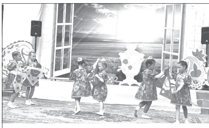
«Золотая Хохлома» в исполнении малышей из детского сада «Колосок»

от». Он сам лично, его воспитанники, их родители в полном порядке содержат