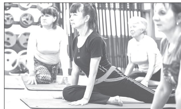
На базе Дворца игровых видов спорта проходят бесплатные занятия для людей старшего поколения