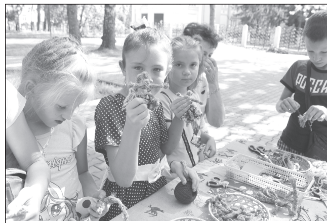
Мастерить куклы нужно с хорошим настроением

Народные куклы на Руси издревле занимали особое место и имели разное предназначение: были игровыми, обрядовыми, обереговыми. Их изготавливали из соломы, веточек, лоскутов, веревки, мха. Уже лет с пяти девочки начинали самостоятельно «вертеть» своих кукол,