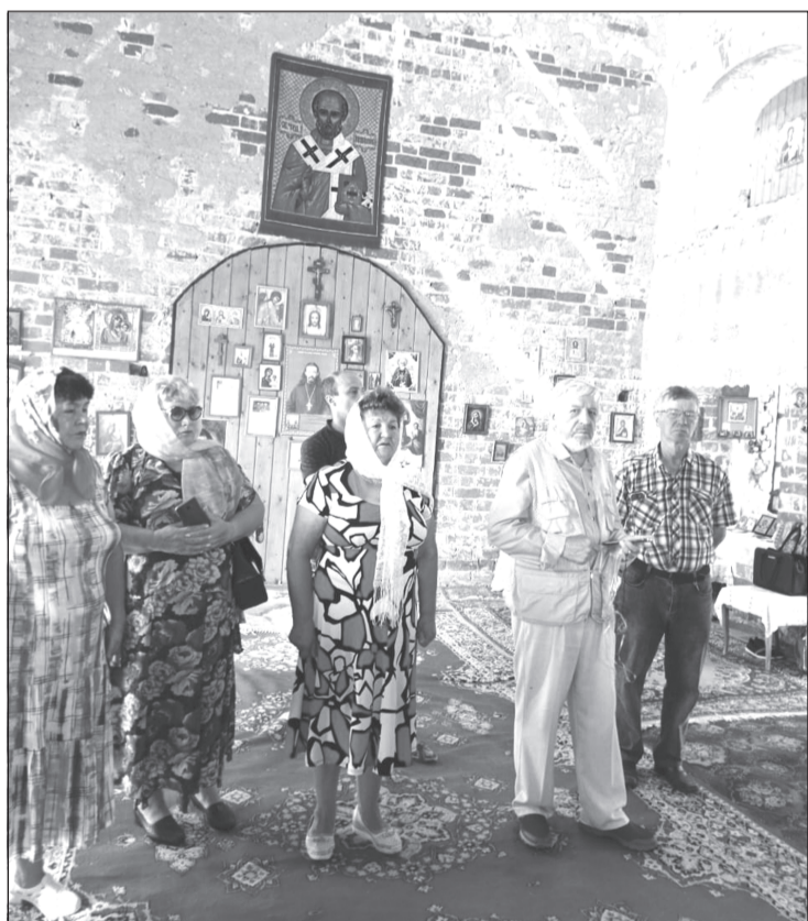
Двери храма Николая Чудотворца открыты для всех