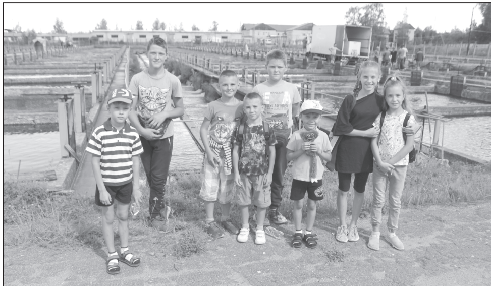
Ребята побывали с экскурсией на Волгореченском рыбном хозяйстве

Восемь ребят из семей, участвующих в пилотном проекте «Мотивация успеха: новая социальная технология преодоления бедности», побывали на экскурсии в ООО «Волгореченское рыбное хозяйство».