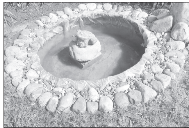
Все фото к данному тексту сделаны на территории детсада №5