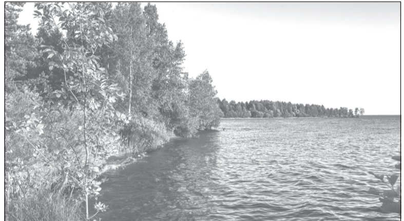
В рамках экологической акции в регионе приведут в порядок места отдыха и другие общественные территории.

Департамент природных ресурсов и экологии приглашает всех жителей Ивановской области внести свой вклад в общее полезное дело и навести порядок во дворах и на прилегающих территориях, детских площадках, у обелисков и в скверах. «Субботник «Зеленая Россия» — это отличная возможность с пользой провести время, подать добрый пример бережного отношения к природе своим друзьям и детям», — отметили в ведомстве.